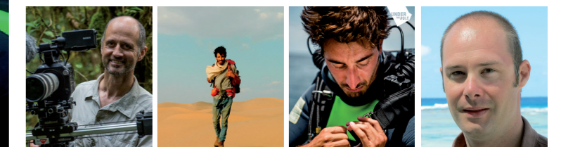
Luc MARESCOT Réalisateur des films Frères des arbres et 700 requins dans la nuit